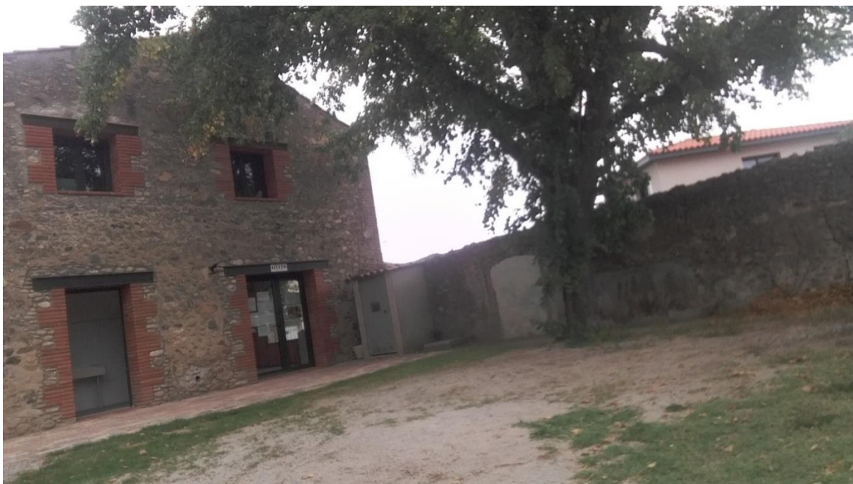
Vue de l'emplacement prévu pour la structure sécurisée de stationnement vélos, au niveau de l'aire de camping-car du camping El Tourou.