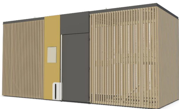
Vue extérieure type de la structure de stationnement vélos sécurisée proposée

L'abris est exclusivement destiné au stationnement de vélos.